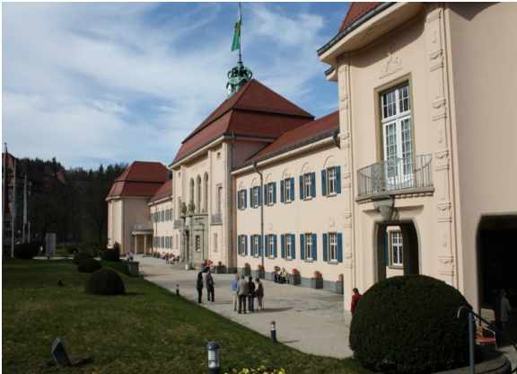
Albert Bad - das zentrale Kurmittelhaus